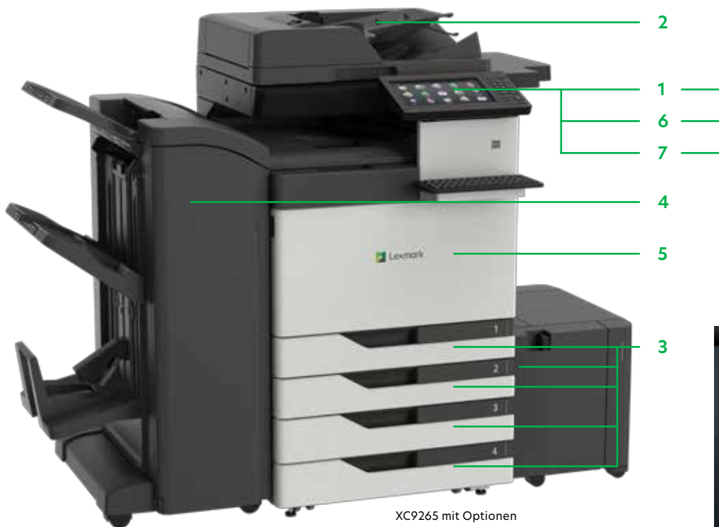
XC9265 mit Optionen

Drucken Sie Microsoft Office-Dateien, PDFs und andere Dokument- und Bildarten von Flash-Laufwerken, oder wählen Sie Dokumente auf Netzwerk-Servern oder Online-Laufwerken aus und drucken Sie sie.